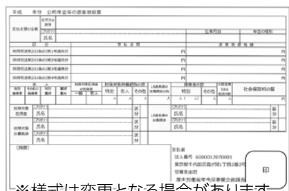
※様式は変更となる場合があります。

※源泉徴収票を紛失した場合は再交付ができますので、日本年金機構津年金事務所または『ねんきんダイヤル』(☎0570-05-1165)へご連絡ください。