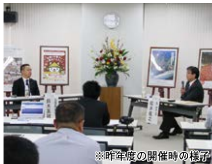
※昨年度の開催時の様子