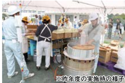
※昨年度の実施時の様子