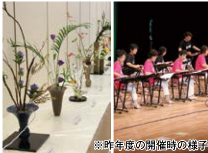
※昨年度の開催時の様子