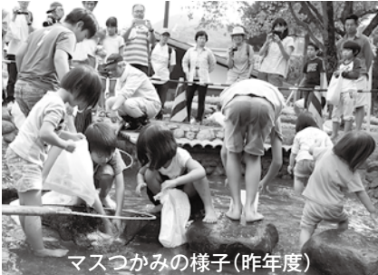
マスカミの様子(昨年度)