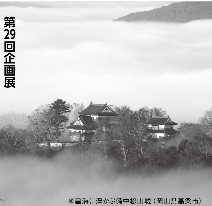
※雲海に浮かぶ備中松山城 (岡山県高梁市)