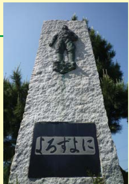
(鹿児島県南さつま市)

鹿児島県の吹上浜近く、陸軍最後の特攻基地「万世飛行場」がありました。終戦直前の1945年7月まで、この飛行場から多くの若き特攻隊員が沖縄に向けて出撃し帰らぬ人となりました。1972年、平和への想いを込めて万世特攻慰霊碑「よろずよに」が建てられ、慰霊祭が毎年とり行われています。このほかにも中村は、沖縄、鹿児島に合計11カ所もの第二次世界大戦関連の慰霊碑を制作しています。「ここに祖国は、その輝かしき復興をとげた。われら生き残りたる者と心ある人々は、英霊の魂魄を鎮め、その偉勲を讃えん…」(碑文より)、後の「詩と祈り」の制作へとつながる原点と言えるかもしれません。