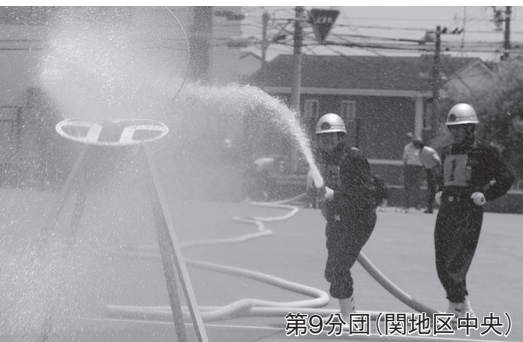
第9分団(関地区中央)