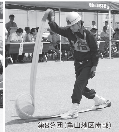
第8分団(亀山地区南部)