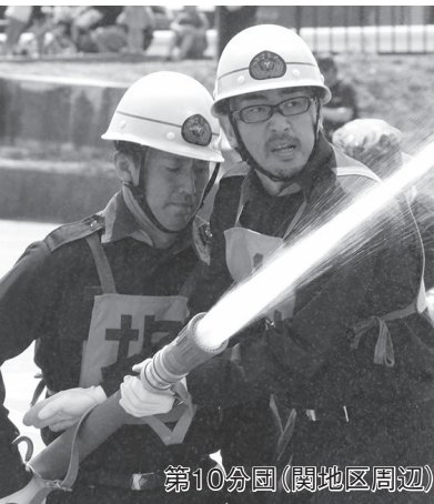
第10分団(関地区周辺)