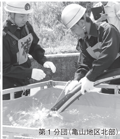
第1分団(亀山地区北部)