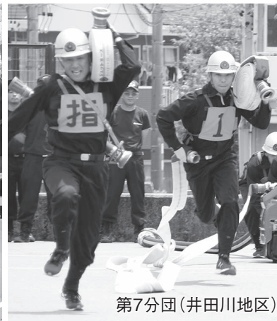
第7分団(井田川地区)