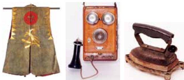
<常設展示の展示物(一部)>