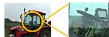
【GPS自動操縦システムの導入】