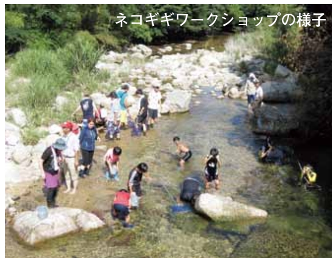
ネコギギワークショップの様子

ネコギギは岩や石の隙間を住み家に使っています。大雨により増水すると土砂などが流入し、隙間が埋まり住み家を失うこともあります。ワークショップでは、川原で塩化ビニル管と透明袋で水中メガネを作り、川の中でネコギギの住み家になりそうなところを探したり、お気に入りの石を探してネコギギのお家作りをしたりしました。