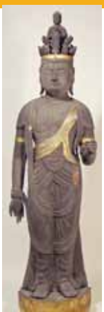
〔木造十一面観音立像〕 佛性寺蔵(土山町平子)土山歴史民俗資料館寄託