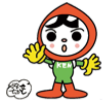
人権イメージキャラクター 人KENまもる君