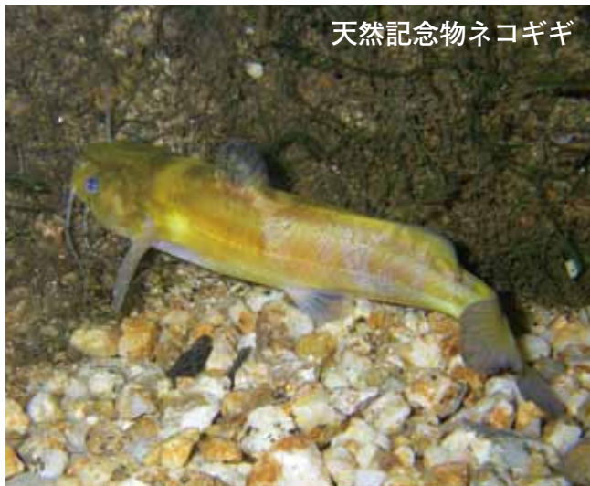
天然記念物ネコギギ