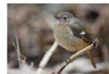
ジョウビタキ(メス)