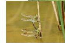
ギンヤンマ(つがい)