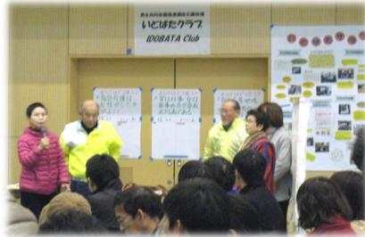
アクティブ亀山の活動をPRするメンバー

今年も人権の祭典であるヒューマンフェスタin亀山で、同クラブの取組の紹介とアクティブ亀山として再出発したことをPRしました。また、シールアンケートにより男女共同参画の啓発を行いました。様々な方にアンケートにご協力いただき、ありがとうございました。