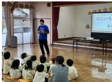
< 井田川幼稚園 >