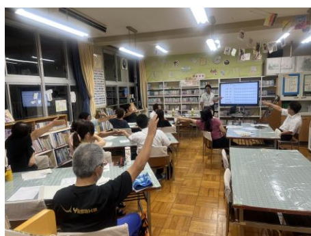
< 中部中学校区人権ネットワーク (野登小学校) >