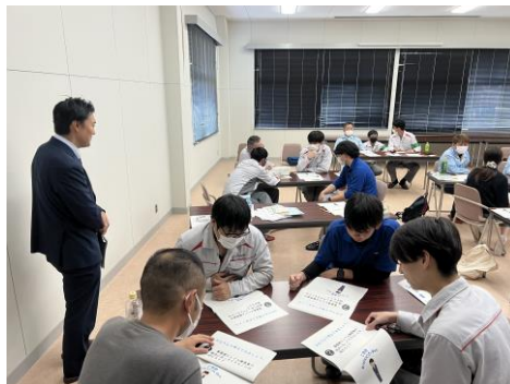
< 古河電気工業労働組合三重支部 >