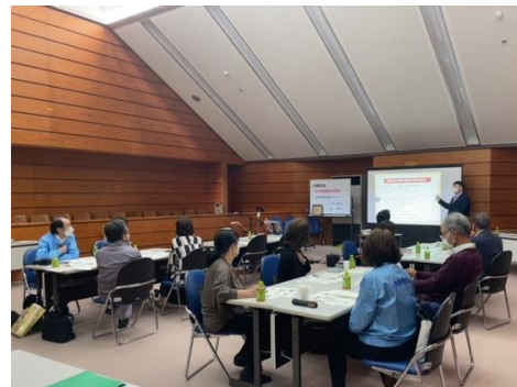
< 津人権擁護委員協議会 >