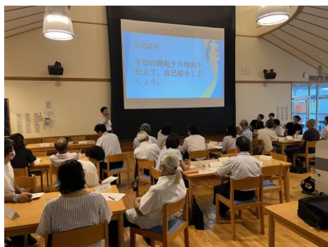
< 亀山中学校区人権ネットワーク >