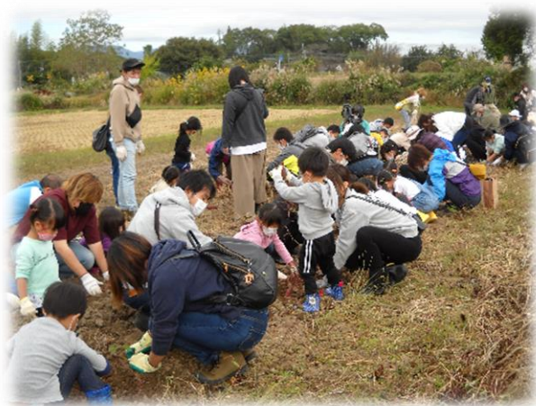
さつま芋堀り体験