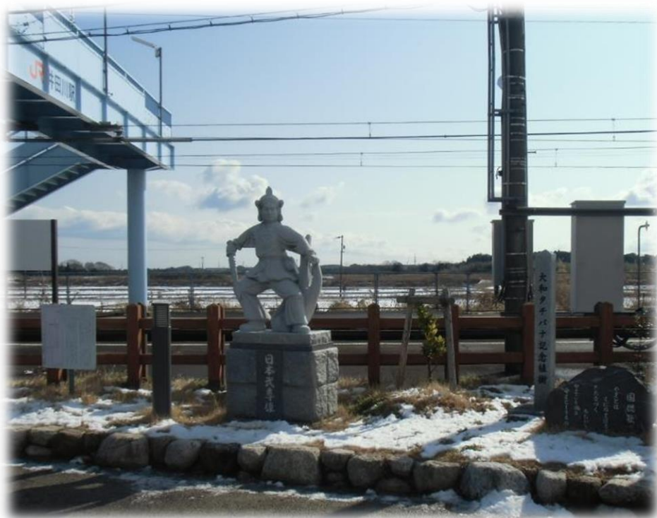
井田川駅前ヤマトタケルゾーン

地域課題の整理は、亀山市北東部まちづくり協議会でワークショップとアンケートをもとに策定された地域ビジョンがありますので、亀山市北東部まちづくり協議会活動で実現した事項を除き、井田川地区南まちづくり計画に反映しました。