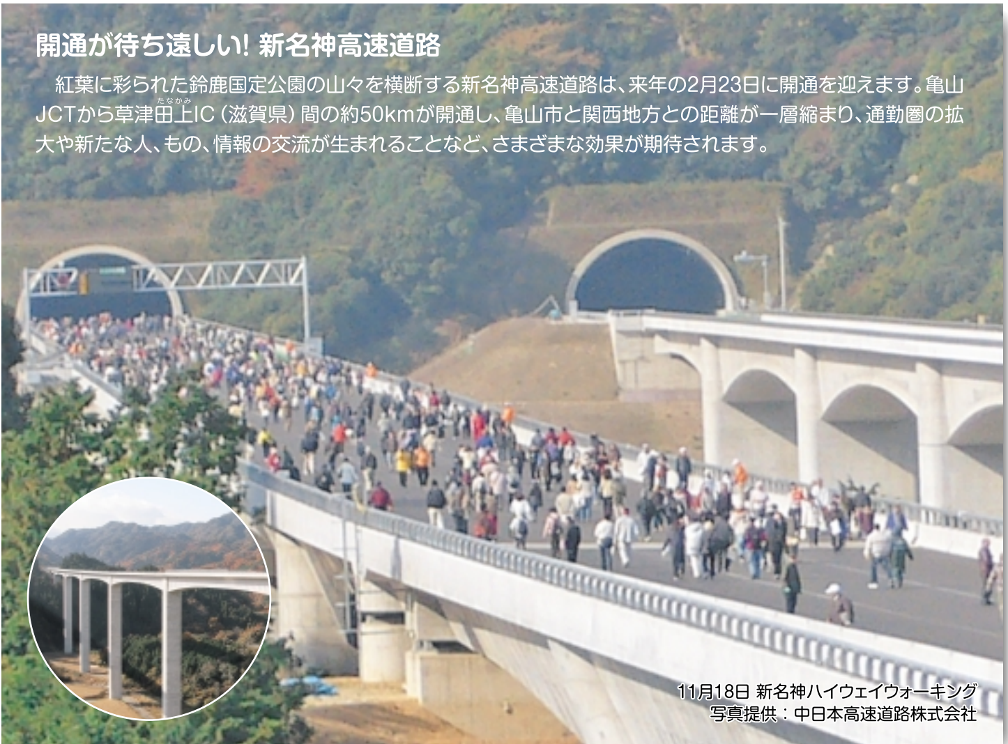
11月18日 新名神ハイウェイウォーキング

紅葉に彩られた鈴鹿国定公園の山々を横断する新名神高速道路は、来年の2月23日に開通を迎えます。亀山 JCTから草津田上IC (滋賀県) 間の約50kmが開通し、亀山市と関西地方との距離が一層縮まり、通勤圏の拡大や新たな人、もの、情報の交流が生まれることなど、さまざまな効果が期待されます。