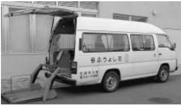
福祉移送サービス車(花しょうぶ)