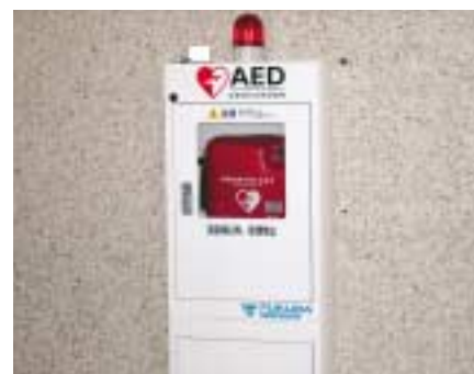
市役所玄関に設置のAED

問 AED（自動体外式除細動器）の公共施設への導入計画については、全国的に人が集まる施設への機器設置が急がれている。当市も八つの公共施設に導入されたが、未設置施設への導入計画と市内事業所への導入指導について伺う。