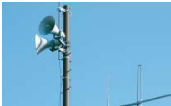
関支所に設置の同報無線

て、市民にいち早く情報を伝達する方法として野外にある拡声機でうまく機能するのかわか。確かに同報無線は関地域では非常に有効に働いているので、それらを含めて多様なメディアについて調査をしている。