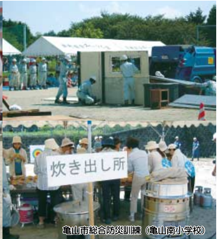
亀山市総合防災訓練（亀山南小学校）