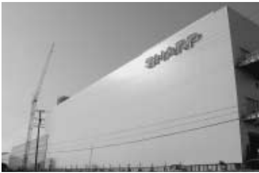
シャープ(株)亀山第二工場

また、農業集落排水事業特別会計では、平成十七年度の市債償還額が約一億二千五百万円、残高は二十九億七千三