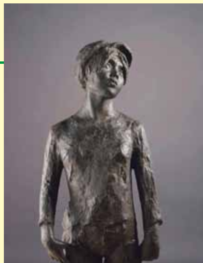
120cm(高さ)×35cm(幅)×30cm(奥行) 中村晋也美術館

親指だけをちょいとGパンのポケットに引っ掛けて、斜め上の空を見上げて佇む、帽子にTシャツ姿の少女像です。はやりのファッションに敏感な若者たちの、何げない日常の仕草に着目しながらも、長袖Tシャツとタイトルの「赤とんぼ」に季節の移り変わり、故郷への郷愁が感じ取れる中村晋也「少女シリーズ」の逸品です。再び猛威をふるうコロナ禍の日本ですが、それでも小さな虫たちは、今年も秋の気配を運んで来てくれています。少女の瞳には青空を自由に飛び交う赤とんぼの群れと、明るい未来が見えているのでしょうか。