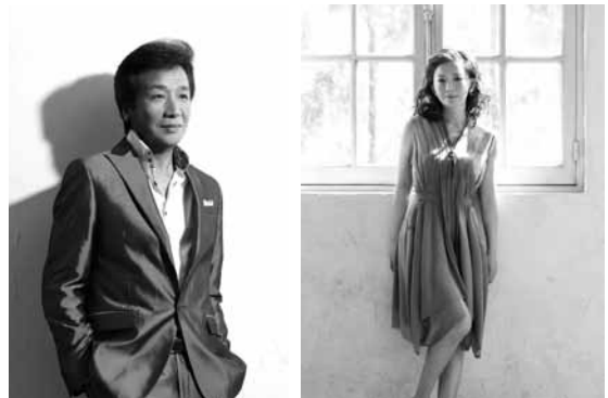
まえかわ きよし 前川 清さん かはら ともみ 華原 朋美さん